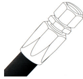
TOP - SCHLAUCH

● Alle Schläuche werden mit Prüfzeugnis geliefert!